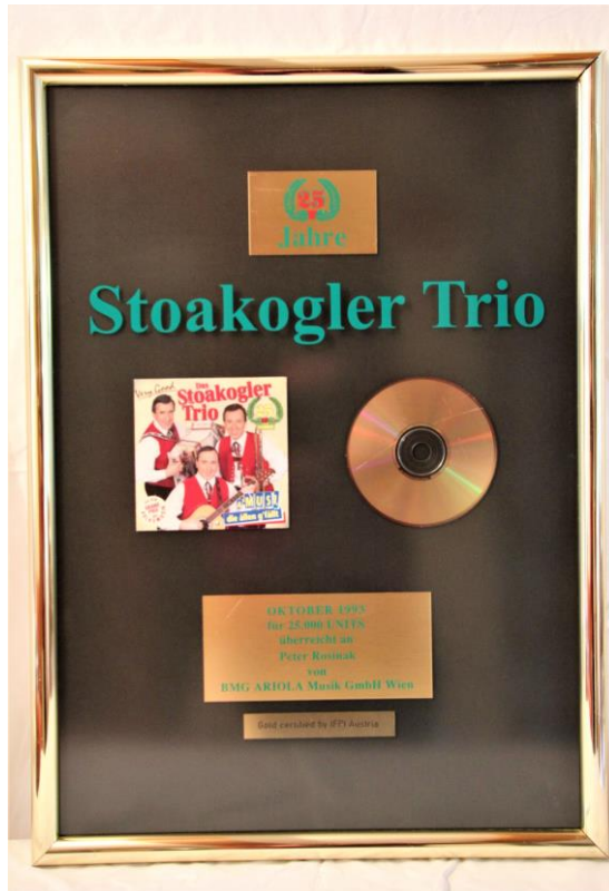
Goldene Schallplatte (CD)