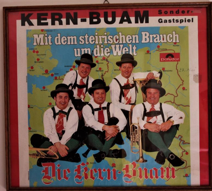
Kern Buam Plakat

Original Plakat der Kern Buam von einem Sondergastspiel in der Wiener Stadthalle am 8.Mai 1975